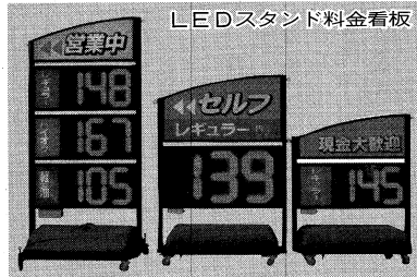
LEDスタンド料金看板

全国キャラバンは当初の反響拡大にともない、一点留り、プレゼンテーション来場者は千人に達したが、SSから「最終的に全国三百拠点」という結果が出た。七月、八月、九月、十月、十一月と、SSの意見を踏まえ、ムラキ側が商材を持って直接SSに訪問・提案する場として、今回提案したLEDスタンド料金看板は「興味はあるが、商品特徴や導入効果をイメージし